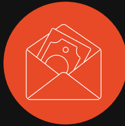
Soborno entre particulares