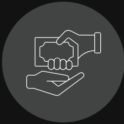
Cohecho a Funcionario Público Nacional y Extranjero