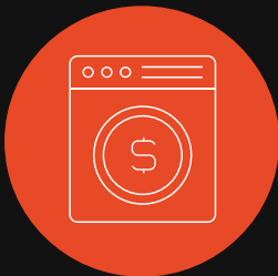
Lavado de Activos