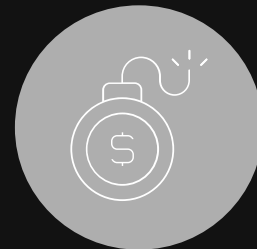
Financiamiento al Terrorismo